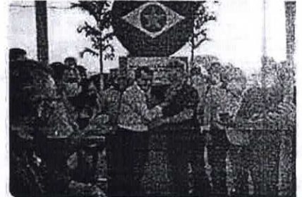
(Imprensa/Galeria-de- Imagens/Visita-do-governador- mauro-mendes-372/)