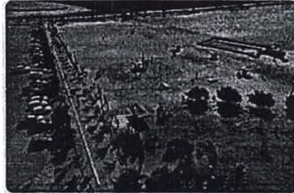
(Imprensa/Galeria-de- Imagens/Circuito-esportivo-lago- azul-373/)